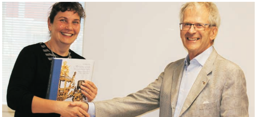
Sällskapetets ordförande överräcker Med pomp og prakt -boken åt muséet.