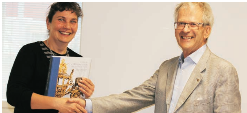
Sällskapetets ordförande överräcker Med pomp og prakt -boken åt muséet.