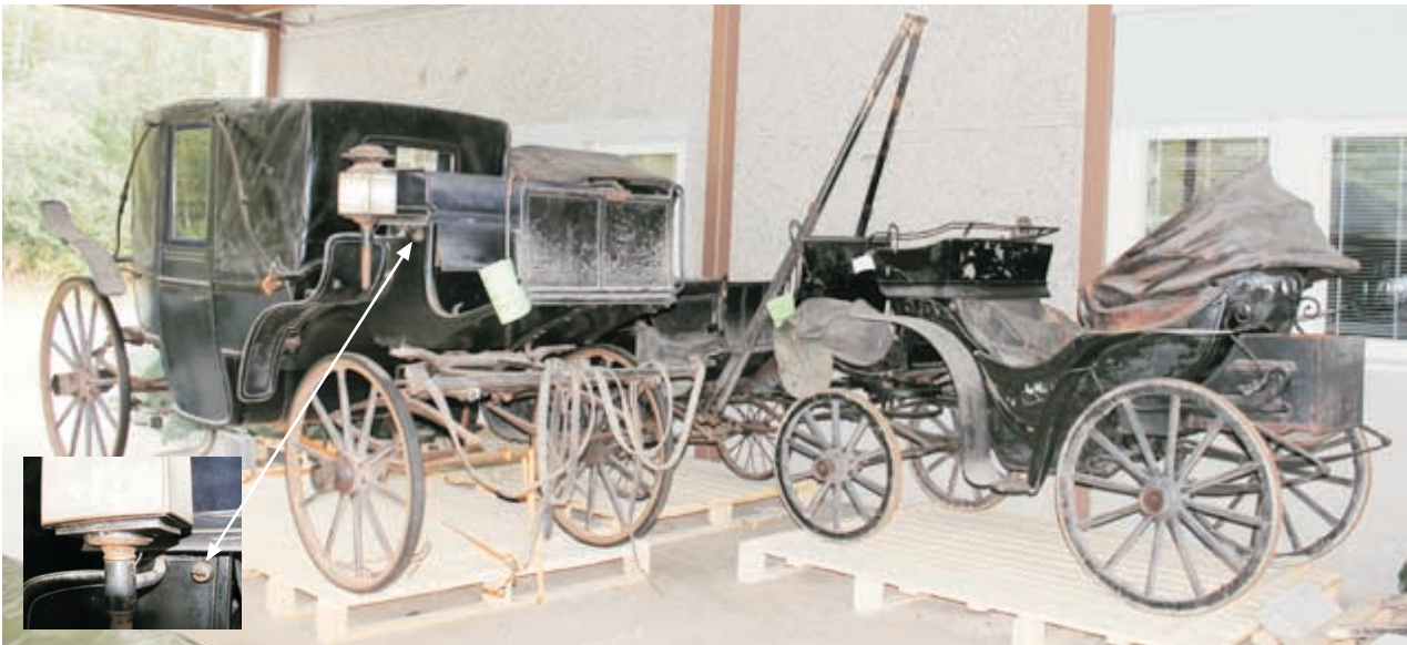
Till specialiteterna hörde i S:t Petersburg på Jakovlevs vagnsfabrik tillverkad elektrifierad Landå.