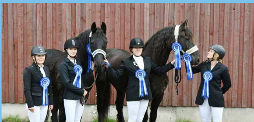
Oh! on, och lunchen väntar i gårdens restaurang och i boxarna.